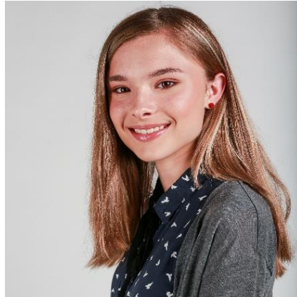
Business-Shooting mit professionellem Foto-Makeup

Um gute Bewerbungsfotos zu erhalten, hat sie bei mir ein Business-Shooting inklusive Makeup durch meine professionelle Stylistin Nicole gebucht.