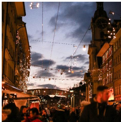
Das Wort Photowalk kommt von "photowalking"

Ich möchte Photowalks organisieren und (Hobby-) FotografInnen zusammenbringen.